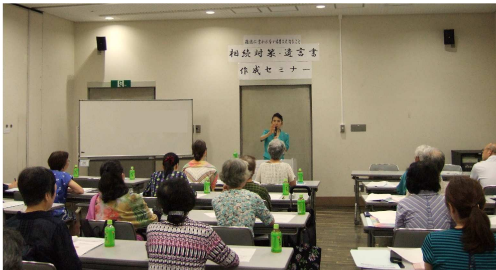
2019年9月6日 北沢タウンホール